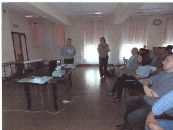
Zdjęcia ze spotkania otwartych z interesariuszami rewitalizacji w dniu 14 czerwca 2016